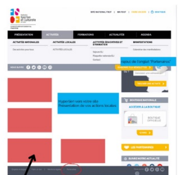
Mockup site internet