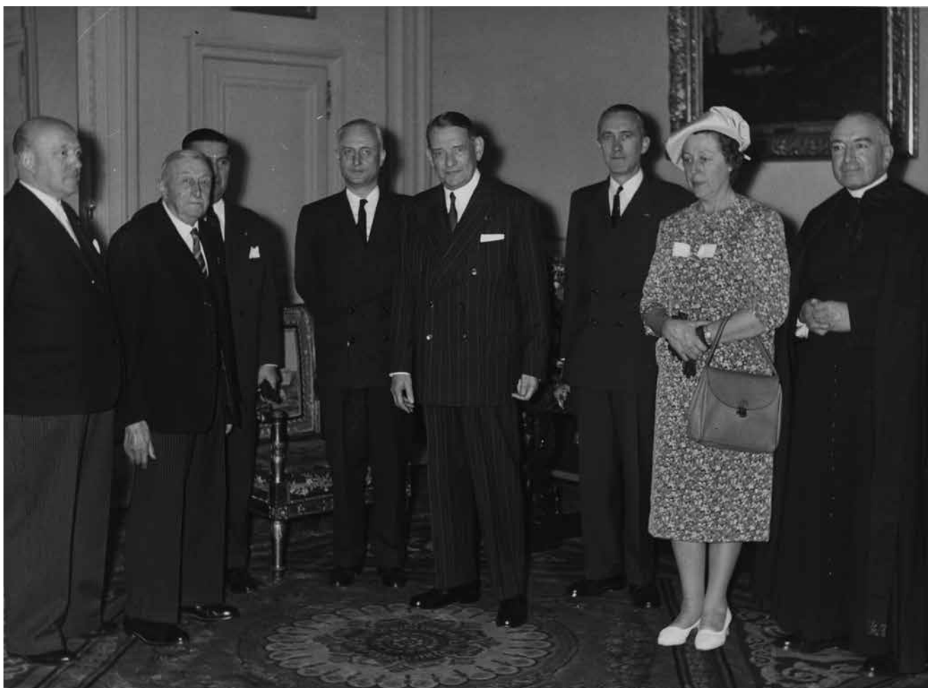
RÉCEPTION DE LA DÉLÉGATION FÉDÉRALE À L'ÉLYSÉE EN 1958

(1929), Anvers (1930), Vienne (1936), Liège (1939) et Alger (1930). Décès de Paul Michaux et fête du 25 e anniversaire (1923). La fédération est à l'initiative de l'assurance sportive en 1924 et du certificat médical en 1930.