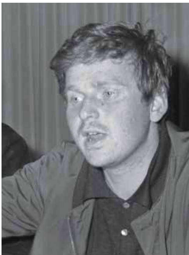
DANIEL COHN-BENDIT, L'HOMME PAR QUI TOUT A COMMENCÉ.

PAS PLUS QUE LES POLITIQUES, LES FÉDÉRATIONS SPORTIVES N'AVAIENT PRÉVU LA FLAMBÉE DE MAI 68, QUI MIT LA FRANCE EN FEU, PUIS EN GRÈVE GÉNÉRALE ET AU BORD DE LA RÉVOLUTION.