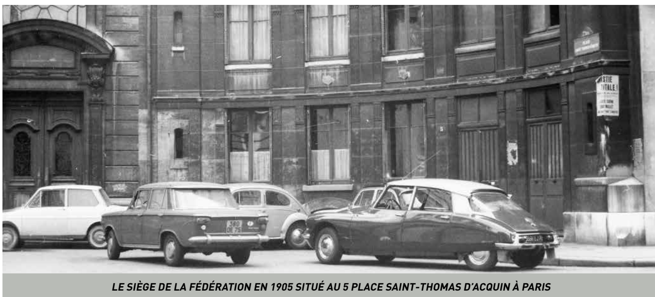
LE SIÈGE DE LA FÉDÉRATION EN 1905 SITUÉ AU 5 PLACE SAINT-THOMAS D'ACQUIN À PARIS

PAR ANALOGIE AVEC LE TOUR DE FRANCE CYCLISTE, CE TEXTE PRÉSENTE UNE HISTOIRE DE LA FÉDÉRATION PAR ÉTAPES DE LONGUEURS INÉGALES AVEC SES LIEUX TYPIQUES, SES PARCOURS PARTICULIERS, SES PERSONNAGES MARQUANTS ET SES ÉVÉNEMENTS SPÉCIFIQUES. LE STYLE TÉLÉGRAPHIQUE CHOISI PAR L'AUTEUR EST DESTINÉ À INCITER LE LECTEUR À APPROFONDIR LE RÉCIT PAR DES RECHERCHES PERSONNELLES.