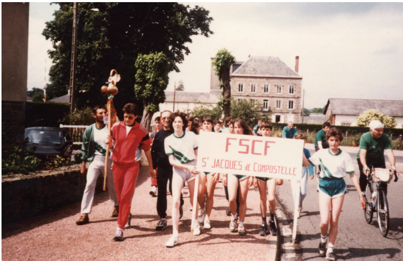
PÉLERINAGE À SAINT-JACQUES DE COMPOSTELLE POUR LE 90 ÈME ANNIVERSAIRE DE LA FÉDÉRATION