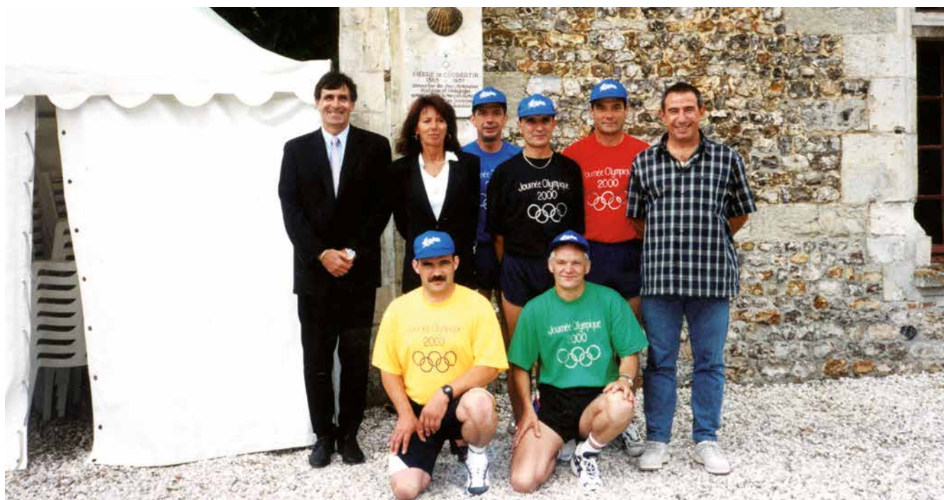
... ET 3 GRANDS CHAMPIONS À L'ESPRIT VRAIMENT OLYMPIQUE ONT COURU AVEC LES RELAYEURS FÉDÉRAUX : JOSEPH MAHMOUD, MÉDAILLÉ D'ARGENT SUR 3000 M STEEPLE AUX JO DE 1984, JEAN-CLAUDE NALLET, DOUBLE CHAMPION D'EUROPE DU 400 M HAIES ET DU 4X400, ET COLETTE BESSON, CHAMPIONNE OLYMPIQUE DU 400 M AUX JO DE MEXICO.