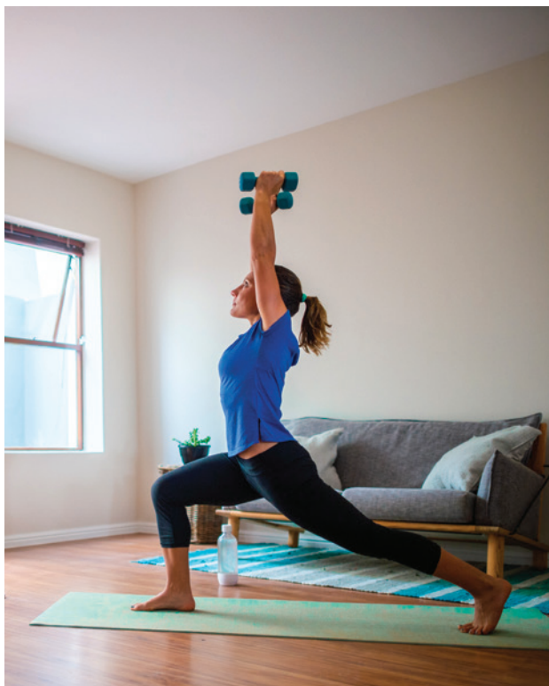
DEUX HEURES ET DEMI D'ACTIVITÉS PHYSIQUES ET SPORTIVES (APS) PAR SEMAINE N'EST PAS SUFFISANT SI L'ON A UN MODE DE VIE SÉDENTAIRE