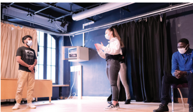
ATELIER DE PRISE DE PAROLE EN PUBLIC

Au-delà des valeurs sportives, l'aspect humain et social de l'association permet aux jeunes de se sentir accompagnés et de leur donner une seconde chance.