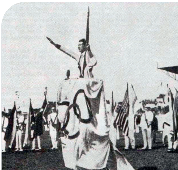
GÉO ANDRÉ PRONONÇANT LE SERMENT OLYMPIQUE AUX JO DE PARIS EN 1924. QUELQUES ANNÉES PLUS TARD, LE SALUT OLYMPIQUE, INSPIRÉ DE L'ANTIQUITÉ ROMAINE, A ÉTÉ DÉTOURNÉ PAR MUSSOLINI PUIS PAR HITLER, QUI EN FIT LE SALUT NAZI.