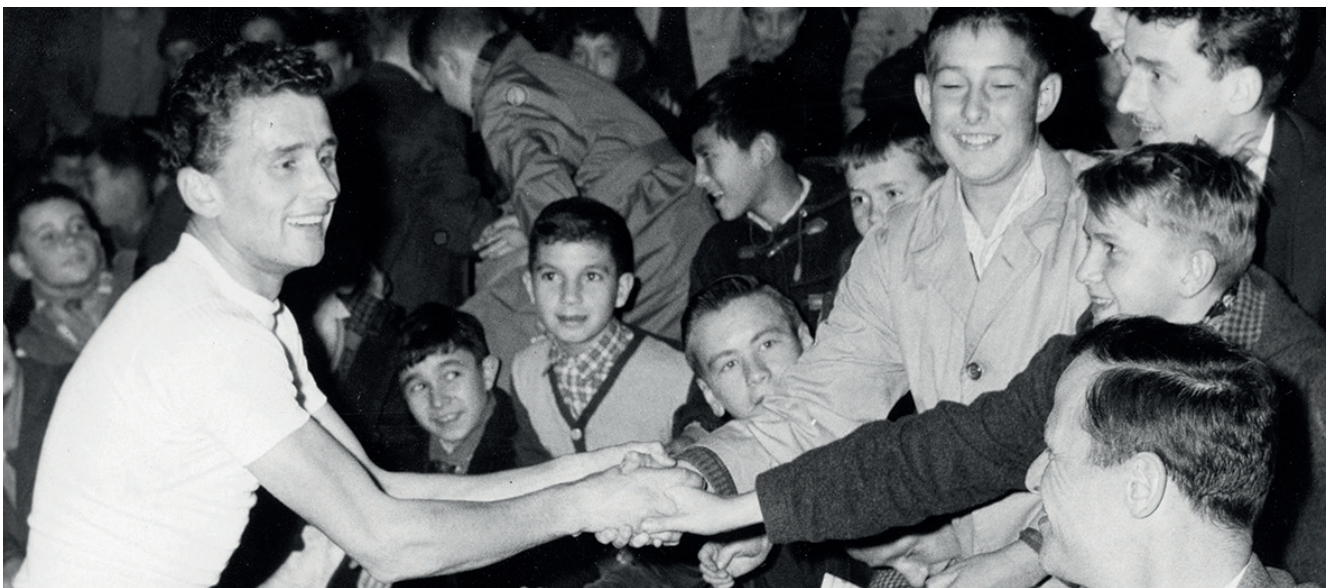
MICHEL JAZY, IDOLE DES JEUNES SPORTIFS DES ANNÉES 60, TRÈS RECONNAISSANT ENVERS LA FSF OÙ IL AVAIT DÉBUTÉ (FOOTBALL) ET QUI RÉPONDIT TOUJOURS PRÉSENT QUAND ELLE FIT APPEL À LUI COMME ICI LORS D'UNE MATINÉE SPORTIVE ET RÉCRÉATIVE.

EN 120 ANS D'EXISTENCE, LA FÉDÉRATION, OUVERTE À TOUS LES MODES DE PRATIQUE, MÊME LES PLUS MODESTES, A PERMIS À DES CENTAINES DE MILLIERS DE JEUNES SPORTIFS D'ATTEINDRE LEUR PLUS HAUT NIVEAU. MAIS IL N'EST PEUT-ÊTRE PAS INUTILE DE RAPPELER QUE, POUR VINGT-CINQ D'ENTRE EUX, CE HAUT NIVEAU A ÉTÉ UNE MÉDAILLE OLYMPIQUE.