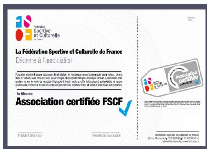
Exemple de diplôme

Enfin, la certification est une reconnaissance officielle de la fédération. Au-delà de l'affiliation, une certification prouve un engagement de l'association dans la vie locale de la FSCF et une garantie du respect de ses valeurs.