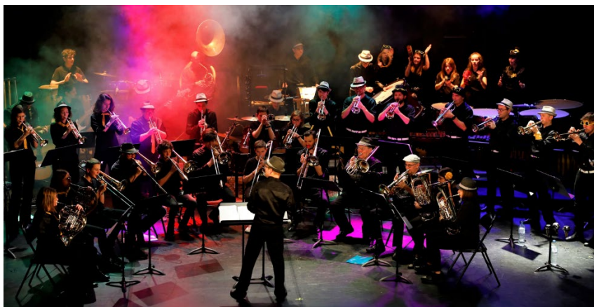
Energie Musique – Banda del Mayor