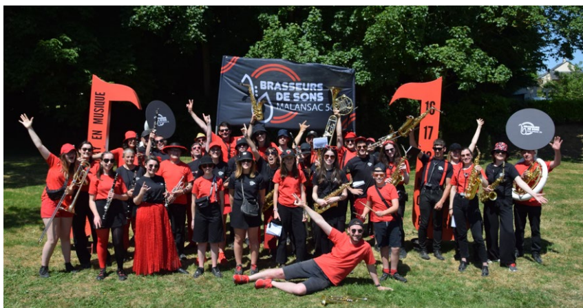
Les Brasseurs de Sons de Malansac