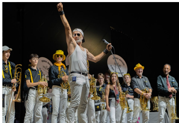
Concert GPN 2025 – Energie Musique