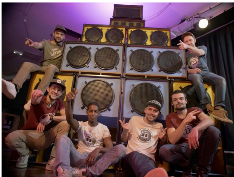
Five Disciple Crew