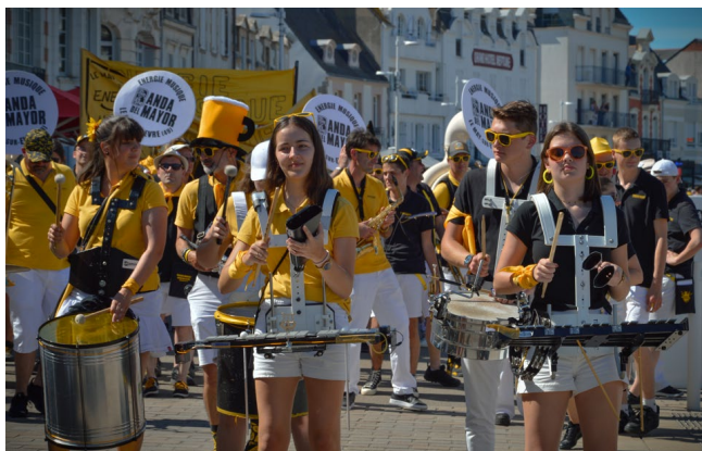
Fanfare en défilé de rue