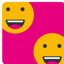
La relation aux autres