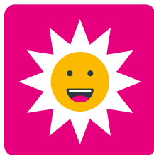
La confiance en soi